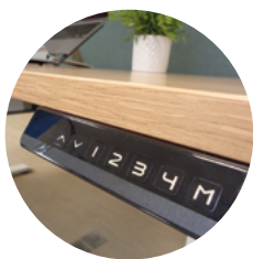
Commande avec 4 positions mémorisables